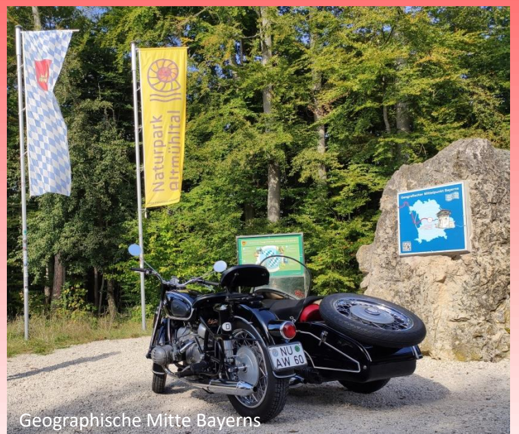
Geographische Mitte Bayerns