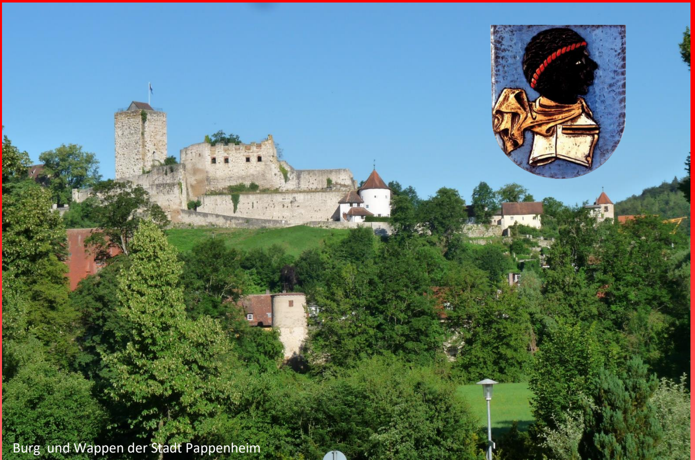
Burg und Wappen der Stadt Pappenheim